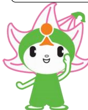
宍粟市のマスコット しーたん

平成31年1月20日(日) 10時～16時(受付9時30分～) サンホールやまさき(山崎文化会館)